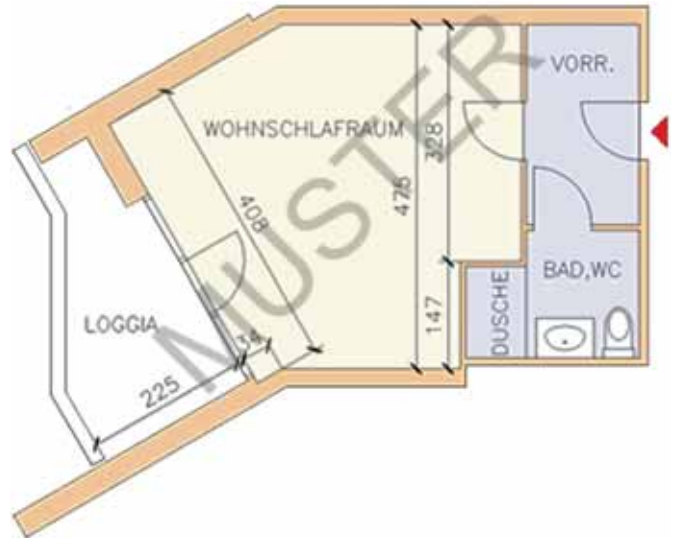
Ein Beispiel für den häufigsten Apartmenttyp im Haus Hetzendorf.

Jedes Appartement ist auf die Bedürfnisse des selbstbestimmten Wohnens im fortgeschrittenen Alter abgestimmt. Den Wohn- und Schlafbereich können Sie nach Ihrem persönlichen Geschmack einrichten. In Doppelappartements gibt es daneben ein separates Schlafzimmer. Zur Grundausstattung gehören ein Vorraum mit Garderobe und eingebautem Schrank sowie Kühlschrank und Speisewärmplatte bzw. Mikrowelle. Das Badezimmer ist mit einer Dusche, einem Waschbecken und einem WC ausgestattet. Jedes der Appartements hat eine eigene Loggia.