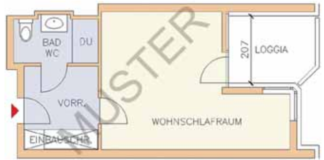
Ein Beispiel für den häufigsten Apartmenttyp im Haus Am Mühlengrund.

Jedes Appartement ist auf die Bedürfnisse des selbstbestimmten Wohnens im fortgeschrittenen Alter abgestimmt. Den Wohn-/Schlafraum können Sie nach Ihrem persönlichen Geschmack einrichten. In Doppelappartements gibt es daneben ein separates Schlafzimmer. Zur Grundausstattung gehören ein Vorraum mit Garderobe und eingebautem Schrank sowie Kühlschrank und Mikrowelle. Das Badezimmer ist mit einer Dusche, einem